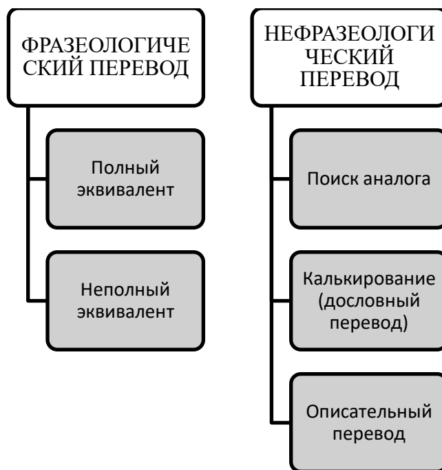
Рисунок 1. Фразеологический и нефразеологические способы перевода фразеологизмов.

Результатом исследования в статье представляем схему способов перевода фразеологических единиц, применительно к политическим речам.